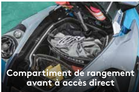
Compartment de rangement avant à accès direct

Ce grand espace de rangement avant est aisément accessible en position assise. 1