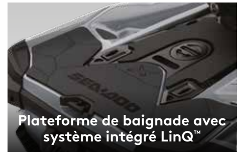
Plateforme de baignade avec système intégré LinQ™

Le premier système audio Bluetooth ‡ étanche de l'industrie entièrement intégré.