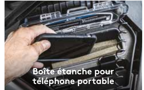
Boîte étanche pour téléphone portable

Optimisée pour les performances au large, cette coque innovante est la nouvelle référence en matière de maniabilité et de stabilité en eaux agitées.