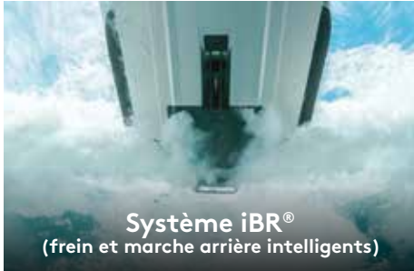
Système iBR® (frein et marche arrière intelligents)

Ce système de fixation rapide exclusif permet d'installer facilement des accessoires de rangement sur la plateforme de baignade la plus grande du marché.